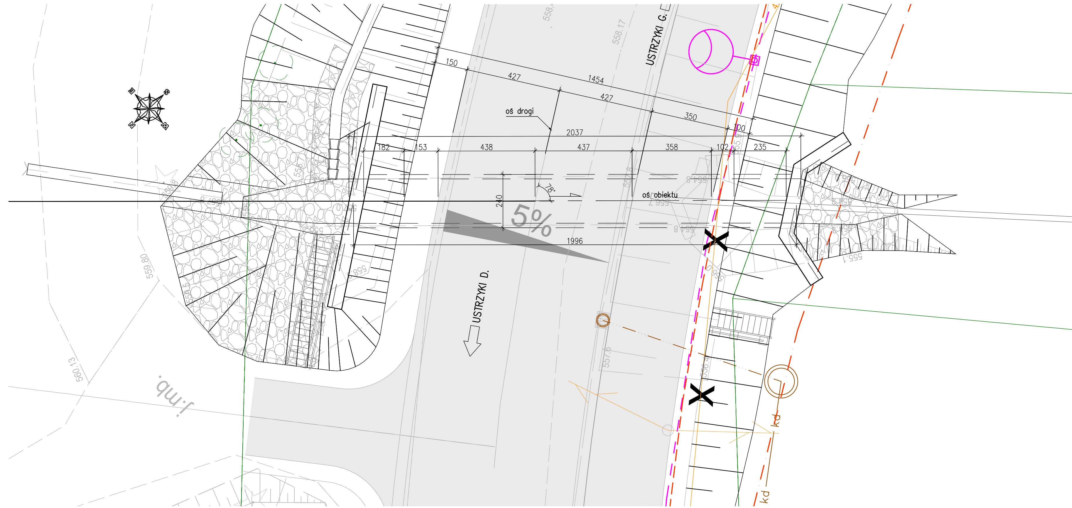
Widok z góry SKALA 1:100